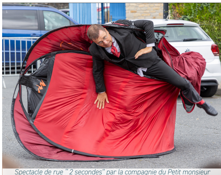
Spectacle de rue "2 secondes" par la compagnie du Petit monsieur

Ce festival est l'occasion, pour beaucoup de personnes en milieu rural de découvrir la diversité des disciplines théâtrales.